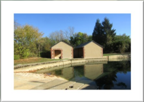
Rénovation du Lavoir du Bourg

Le Bourg : - Reprofilage du terrain de sports - Rénovation de la salle de sport - Réfection du chemin de la Perrière - Travaux d'accessibilité à l'église (éclairage sous le balcon et plans inclinés), au Cimetière et à la cantine scolaire. - éclairage du parking de la Salle Fernand Auchère et du terrain de Pétanque - enrobé Impasse de la Saumonnière - Réfection du lettrage (peinture) sur le Monument aux Morts et gravillonnage du sol - Réfection du parking Mairie/Médiathèque - Remplacement du revêtement de sol intérieur de la salle de classe de l'école - Peinture de l'intérieur de l'église et du retable (rénovation) - isolation et couverture du logement de la Maréchalerie