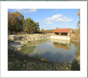
Rénovation du Lavoir de la Tour

- Logement de la Motte : travaux de rénovation intérieur - Route de Vauvredon : curage des fossés et gravillonnage