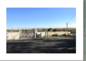
Réfection du Parking du Cimetière et ravalement des murs de façades