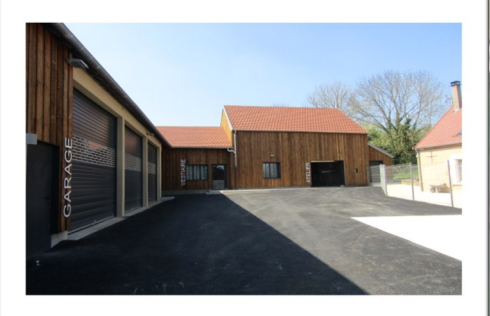
Réhabilitation des Ateliers Municipaux

Chemin de La Jarrerrie/La Bussière : Travaux de réfection