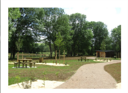
Aménagement du site de l'étang

- Logement de la Motte : travaux de rénovation intérieur - Route de Vauvredon : curage des fossés et gravillonnage